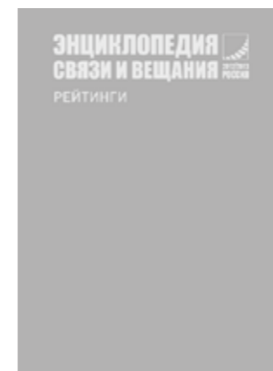
Telecoms & Broadcasting Encyclopedia (Annual ratings)

Ежегодники COMNEWS самый полный источник информации о деятелях российского рынка ИКТ