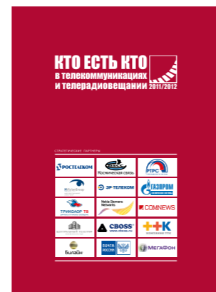
Who is Who in telecoms & broadcasting RUSSIA